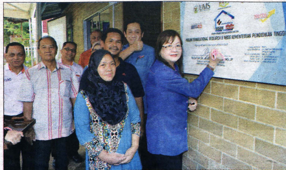
RASMI...Mary Yap menandatangani plak perasmian Rumah Komuniti Parlimen Tawau.