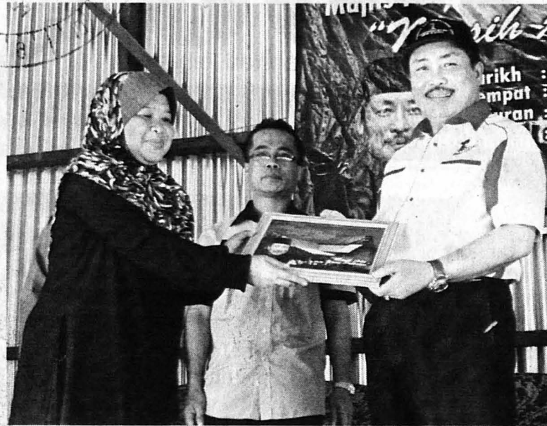
HAJIJI menerima cenderahati daripada wakil Unisza

"Selain Kg Lok Nunuk, terdapat dua kampung lain yang menjadi perhatian kami sebelum ini iaitu Kg Serusop dan Kg Penimbawan tetapi memandangkan Lok Nunuk memenuhi kriteria maka kami mengambil keputusan untuk berkampung di sini," katanya selepas berakhirnya program yang bermula pada 13 hingga 18