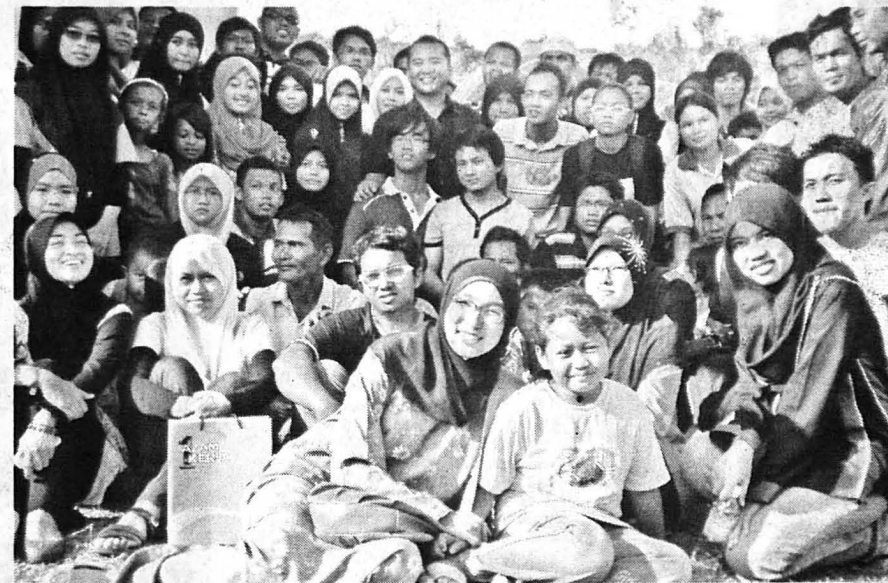
MAHASISWA dan mahasiswi bergambar kenangan selepas tamat program berkenaan.

"Ini juga secara tidak langsung akan dapat membantu para mahasiswadan mahasiswi membuat kajian tentang kebudayaan, adat dan bahasa masyarakat Bajau yang merupakan antara etnik