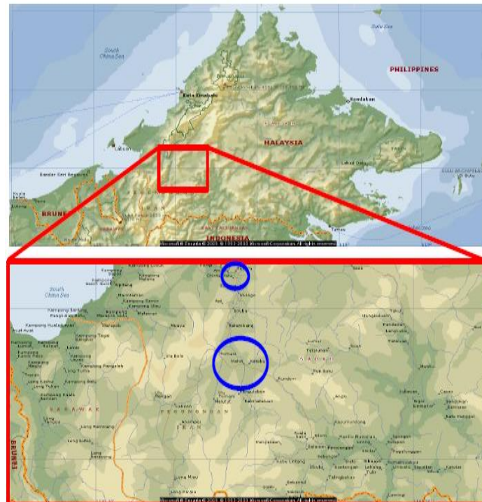
Rajah 1 Peta lokasi Kampung Imahit, Tenom, Sabah