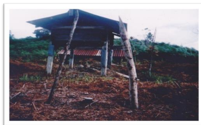
Rajah 4 Gambar kuburan Finandaian