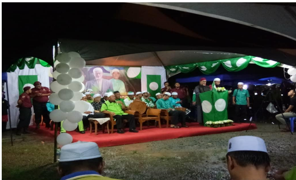
Rajah 1 Majlis pengumuman calon PAS Sabah PRU-14 oleh Presiden PAS