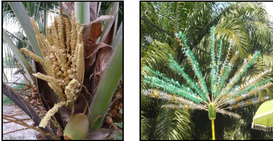
Gambar 4 : Bunga Kelapa dan Bunga Manggar. Kesamaan Bentuk dan Ciri yang dilihat pada Bunga Kelapa dan Bunga Manggar (Sumber: Kajian Lapangan)