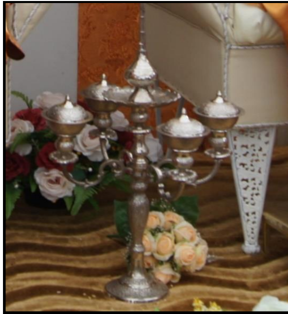
Gambar 2: Pada Bahagian Atas Alat Merenjis Itu Terletak Bekas Air Mawar