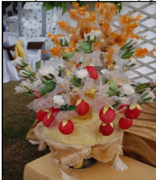
Gambar 3: Bunga Telur yang Diletakkan di Atas Pulut Semangat

Hal yang demikian selaras dengan apa yang dikemukakan oleh Strange (1981) yang mendapati bahawa telur rebus merupakan lambang kesuburan; dengan kulitnya dicelup warna merah, diikat pada sebatang buluh kecil dan dihiasi bunga dan daun yang dibuat daripada kertas berwarna, di mana ia menjadi buah tangan kepada tetamu yang hadir ke majlis.