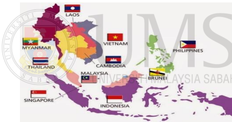
Peta 1.1: Negara-negara Asia Tenggara

Era pasca kolonialisme yang berlaku di Asia Tenggara merupakan satu fasa yang amat penting yang mana era ini telah membawa kepada berlakunya pembentukan negara bangsa yang mengutamakan jaringan serta hubungan dengan negara luar, jati diri bangsa, kebudayaan dan juga pengukuhan sempadan politik.