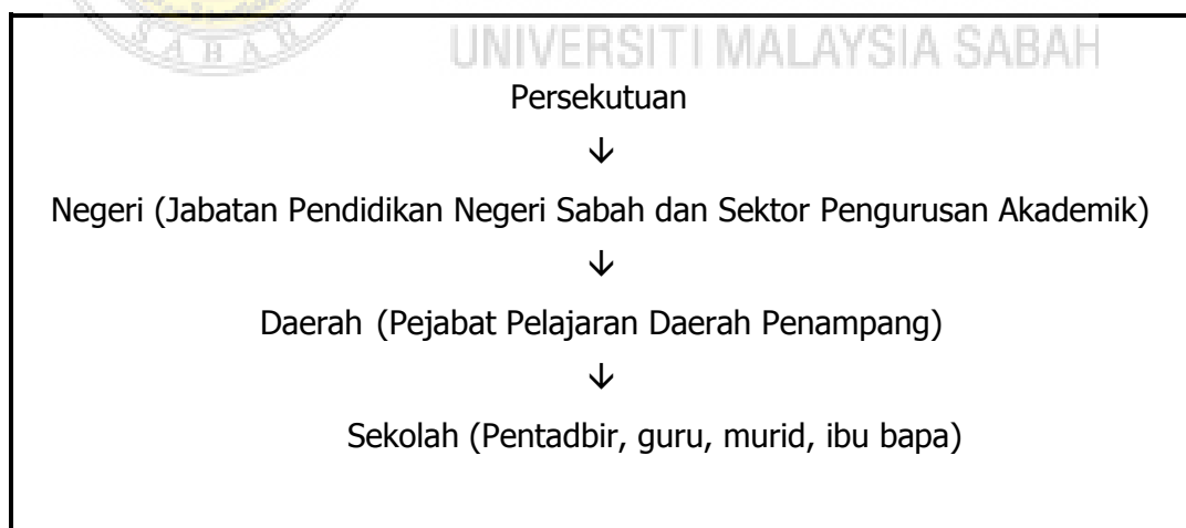
Rajah 1.1: Struktur Pengurusan Pendidikan di Malaysia