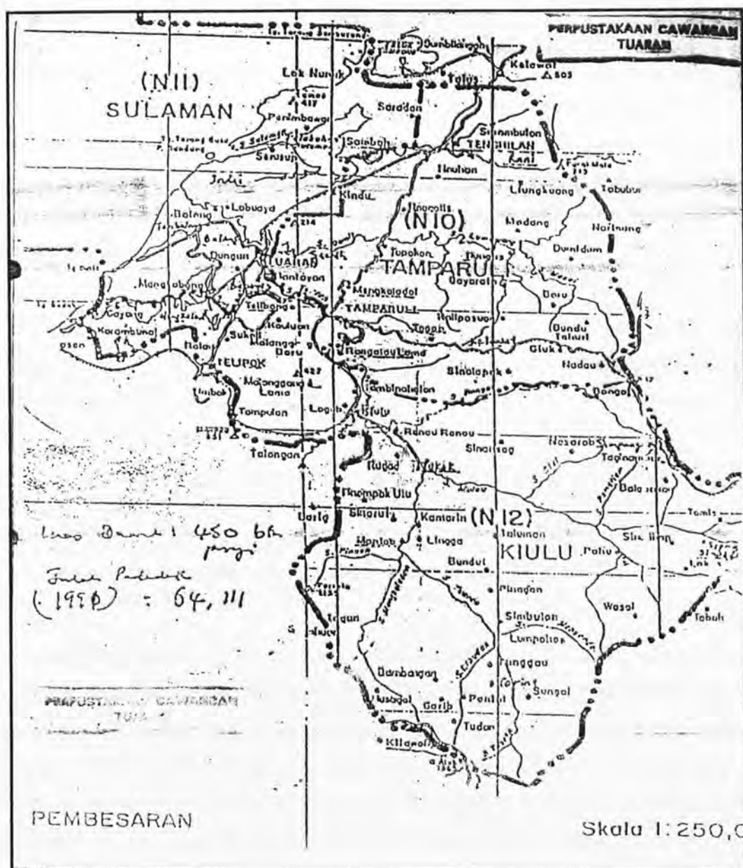
Rajah 1.1: Peta Daerah Tuaran