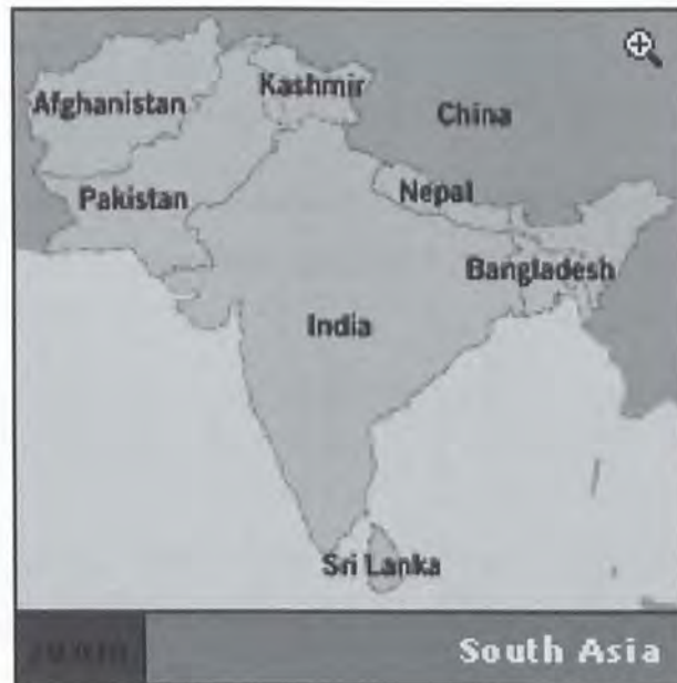
Gambar 1: Kedudukan Sri Lanka di rantau Asia Selatan. 9

Mannar dan Semenanjung Palk memisahkan Sri Lanka dengan bahagian selatan tanah besar India. 8