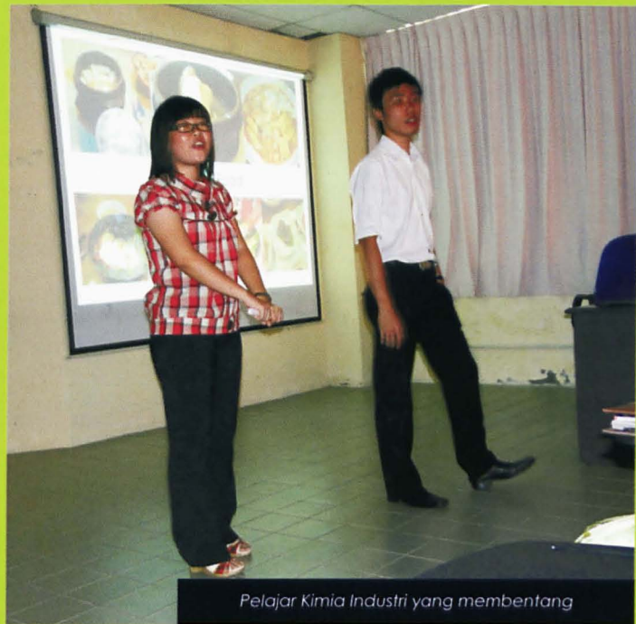
Pelajar Kimia Industri yang membentangkan