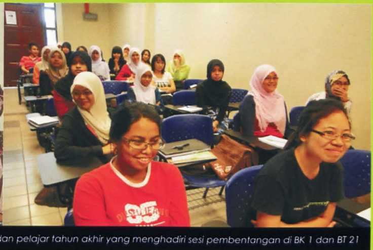
Pensyarah dan pelajar tahun akhir yang menghadiri sesi pembentangan di BK 1 dan BT 21